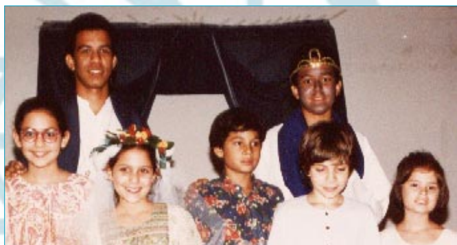
"A MENINA BUSCADORA", em agosto de 95

A Yuva Shakti foi iniciada no Brasil em julho de 1995, no Rio de Janeiro. Mesmo com pouco tempo de existência, trabalhou ativamente na visita de Shri Mataji ao Brasil, em agosto de 95. Apresentou a Nossa Querida Mãe, uma peça de teatro escrita e representada pelos próprios Yuvas, "A MENINA BUSCADORA".